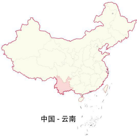
中国 - 云南