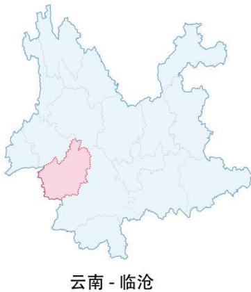
云南 - 临沧