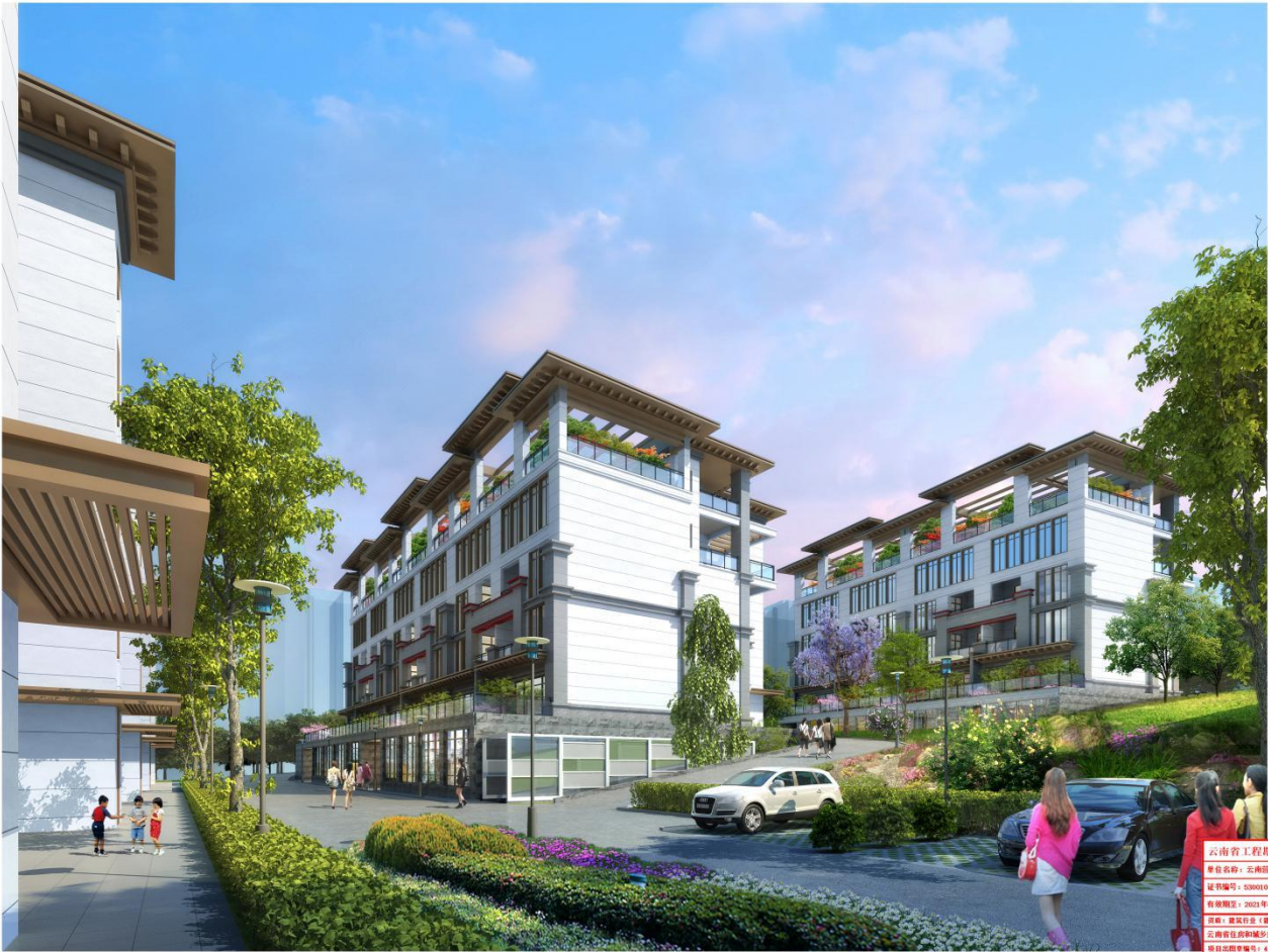
住宅区内部透视图