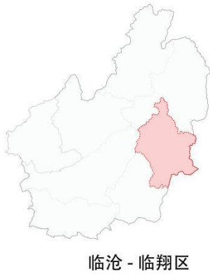
临沧 - 临翔区